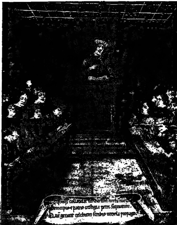
Enseignement du droit à l'université de Bologne au XV e siècle. Musée civil de Bologne.